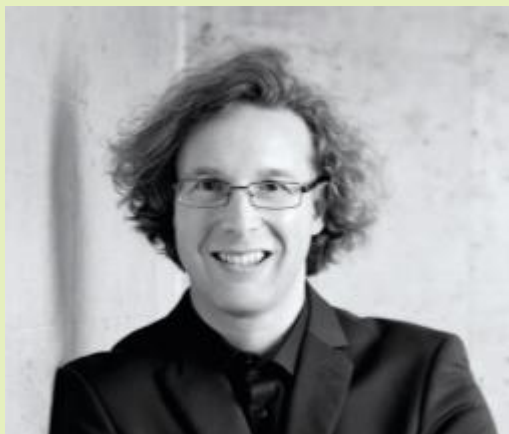
(Leiter des Projekts: Sascha Roder)

Der Weg zum entspannten Hören und Verstehen mit Cochlea-Implantaten kann langatmig und voller Hindernisse sein. Trotz der innovativen Technik ist es der Mensch, der sich mit dieser neuen Akustik-Welt anfreunden und gleichzeitig eine Vielzahl von Eindrücken unter ganz neuen Bedingungen aufnehmen, verarbeiten und einsortieren muss. Hier kann ein gezieltes und differenziertes Hörtraining von professioneller musikalisch-pädagogischer Seite eine erhebliche Erleichterung bringen und ein wichtiges Unterstützungsangebot im Umgang mit der Hörprothese sein.